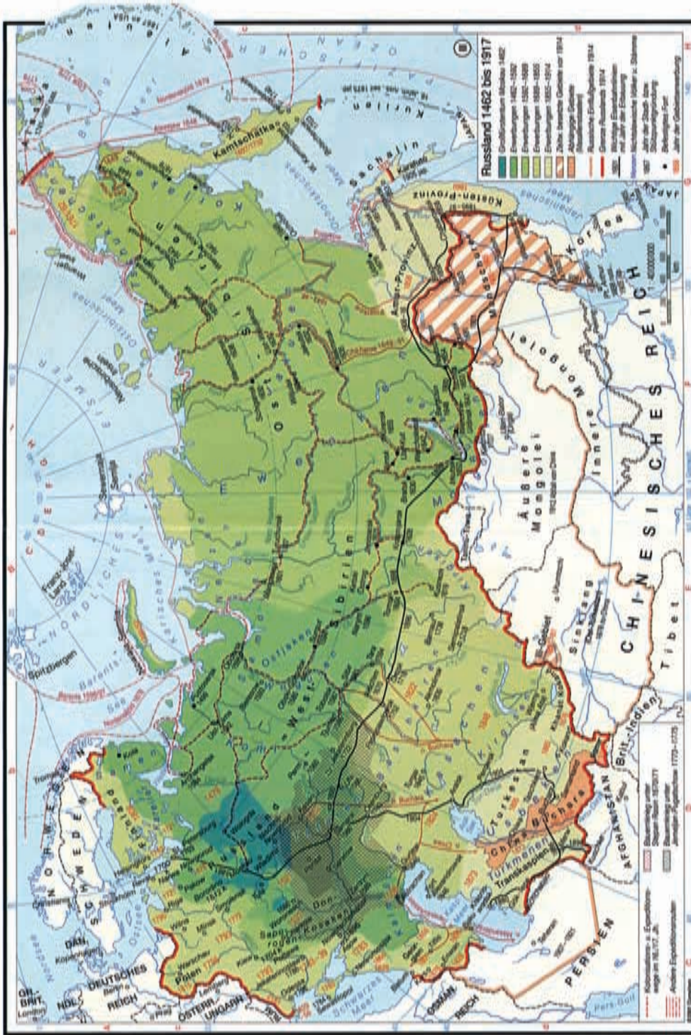
Abb. 1: Karte „Russland in den Grenzen von 1462–1917“.