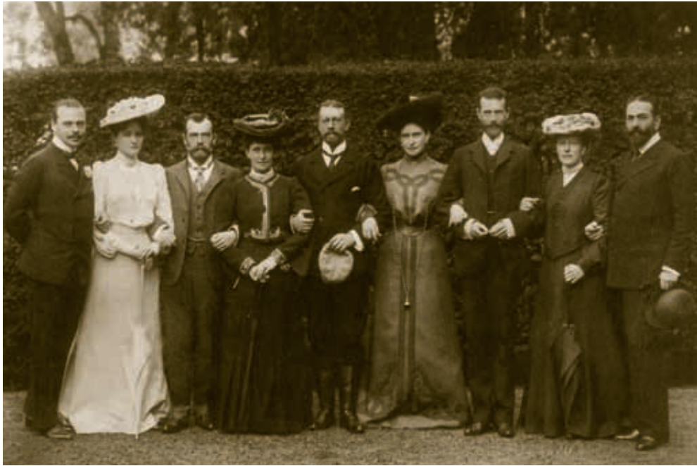
Abb. 4: Zarin Alexandra aus dem Hause Hessen-Darmstadt im Kreise der europäischen Verwandten 1903 (von links: Großherzog Ernst Ludwig, Zarin Alexandra Fjodorowna, Zar Nikolaus II., Prinzessin Irene, Prinz Heinrich von Preußen, Großfürstin Elisabeth, Großfürst Sergej, Prinzessin Victoria, Prinz Ludwig von Battenberg).

trieben, ist Großherzog Ernst Ludwig zu nennen, der die Vermittlung des Jugendstils mit dem Export von Kunstgewerbe verband. Symbolträchtig für das 20. Jahrhundert ist die Tatsache, dass die sowjetische Automobilindustrie erst durch kriegsbedingte Demontagelieferungen aus Rüsselsheim in die Gänge kam. Bei der ersten Generation des Moskwitsch handelte es sich um eine nahezu originalgetreue Kopie des Opel Kadett.