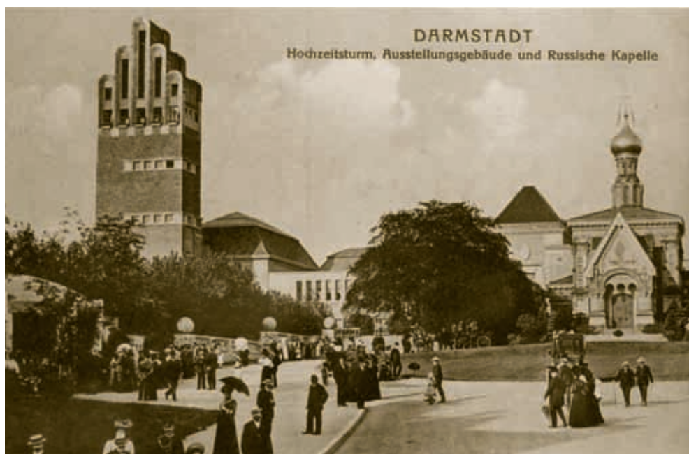
Abb. 5: „Darmstadt: Hochzeitsturm, Ausstellungsgebäude und Russische Kapelle“, Postkarte um 1908.

Unter diesen Voraussetzungen fügen sich die Lehrstuhlmitarbeiter mit den folgenden wissenschaftlichen Profilen in das Zukunftskonzept der Justus-Liebig-Universität Gießen ein: Aufgrund einer Dissertation über die Moskauer Historikerschule im ausgehenden Zarenreich und einer Habilitation über den Wiederaufbau der Stadt Minsk nach dem Zweiten Weltkrieg ist der Verfasser durch inhaltliche Schwerpunkte in den Bereichen Historiographiegeschichte und Erinnerungskulturen einerseits und Stadtgeschichte und Urbanisierungsforschung andererseits ausgewiesen. Neuerliche Interessen beziehen sich auf Aberglauben und Nonkonformismus, ansetzend beim Vampirismus der Frühen Neuzeit und abschließend mit dem Eigensinn im Sozialismus. Anknüpfend an das Gesamtkonzept erforschen die Mitarbeiter Birte Kohtz und Rayk Einax Männlichkeitsdiskurse im ausgehenden Zarenreich sowie Entstalinisierungsdebatten in der Chruschtschow-Ära. Aliaksandr Dalhouski un-