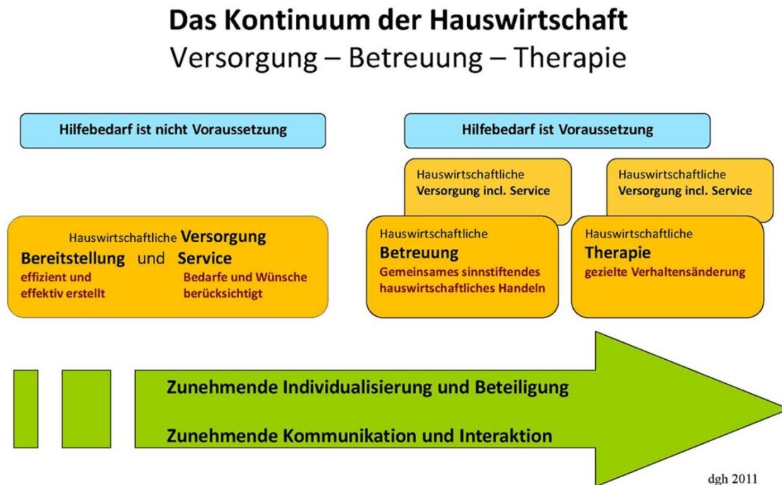
Abbildung 1: Das Kontinuum der Hauswirtschaft

num der Hauswirtschaft, in dem sowohl die Charakteristika der Handlungskonzepte dargestellt sind, als auch die in der Praxis zu beobachtenden fließenden Übergänge deutlich werden.