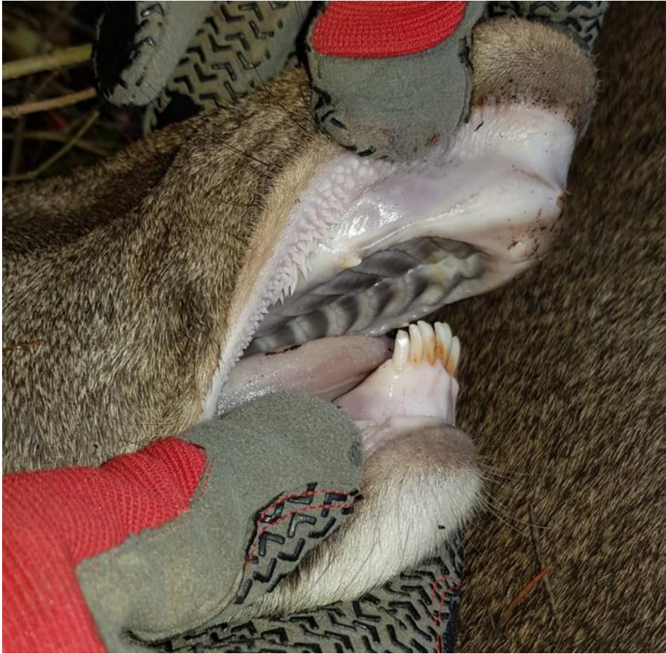
Abb. 2: Inzuchtdepressionen, wie die Unterkieferverkürzung bedrohen die Gesundheit und das Wohlbefinden des Rotwildes und lassen massive Einbußen für Fruchtbarkeit und Vitalität der betroffenen Populationen befürchten.