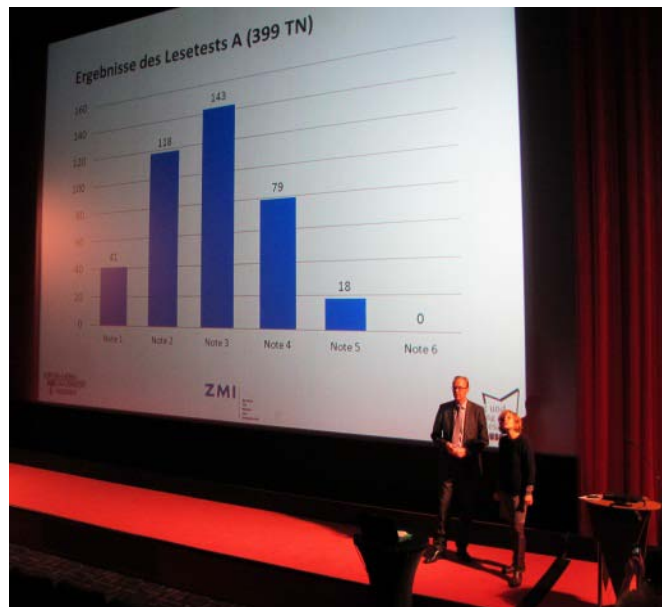
Hennig Lobin und Katrin Lehnen (v. l. n. r.)

Ein weiteres Untersuchungsinstrument waren die Fokusgruppenerhebungen. Fokusgruppen sind kleinere Gruppen von Auszubildenden, die datengeleitet nach verschiedenen Kriterien aus der Gesamtgruppe ausgewählt wurden (z.B. nach Testergebnissen, aber auch nach Alter oder Berufsgruppe). Innerhalb von Einzel- und Gruppenbefragungen konnten über diese Fokusgruppen zum einen Einblicke in die Wahrnehmung des Projekts aus Perspektive der Teilnehmenden gewonnen werden. Zum anderen konnten die individuellen Herangehensweisen bei der Aufgabebearbeitung differenzierter betrachtet werden.