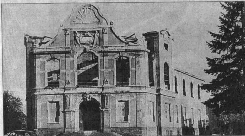
Die Fassade der zerstörten UB.

Heute vor 60 Jahren wurde Universitätsbibliothek bei Bombenangriff zerstört – 90 Prozent des Bestands vernichtet