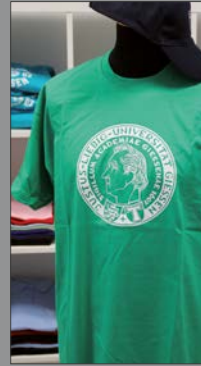
1 | Unisex T-Shirt