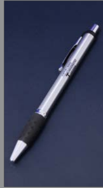
3 | Kugelschreiber silber