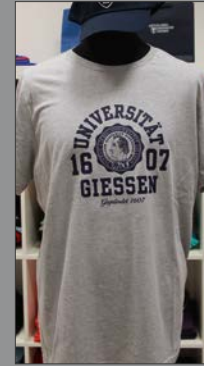
2 | Herren T-Shirt „Seit 1607“