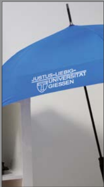
7 | Regenschirm