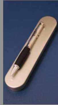
4 | Laserpointer