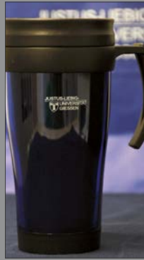
2 | Thermobecher