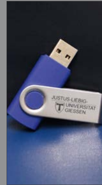
11 | USB-Stick