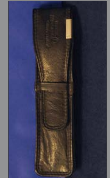
12 | Stifteetui