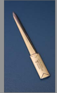
6 | Brieföffner