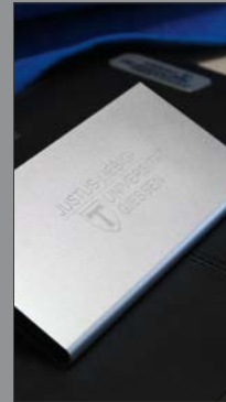
11 | Powerbank