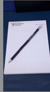
5 | Schreibset