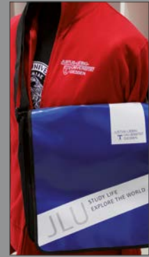
6 | Umhängetasche