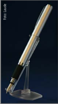
1 | Füllfederhalter