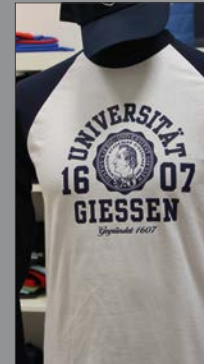
5 | Raglan-Longsleeve