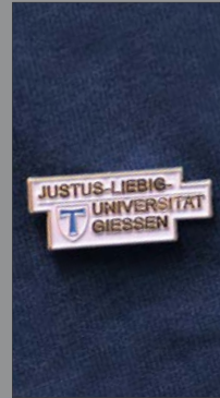
10 | Anstecknadel