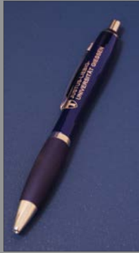
2 | Kugelschreiber blau