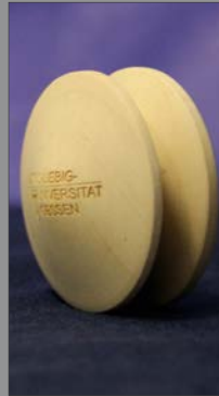
9 | Fotohalter