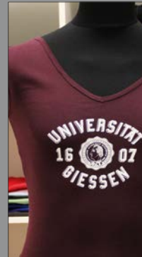
4 | Damen V-Neck