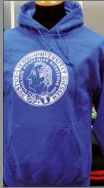
3 | Sweatshirt