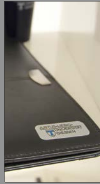
4 | Dokumentenmappe