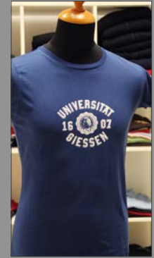
3 | Damen T-Shirt „Seit 1607“