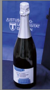
3 | Sekt