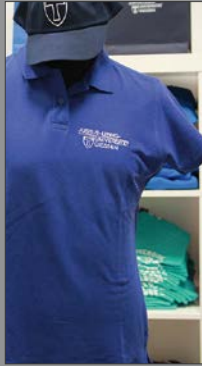
2 | Poloshirt