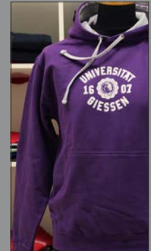
6 | Kontrast-Sweatshirt

Poloshirt T-Shirt Sweatshirt Longsleeve Cap Jacke Laufshirt