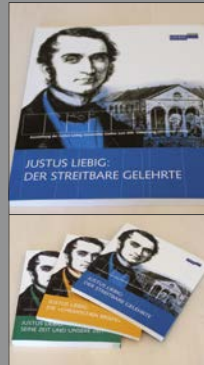
9 | Liebig-Ausstellungsbände