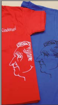
6 | Kinder T-Shirt