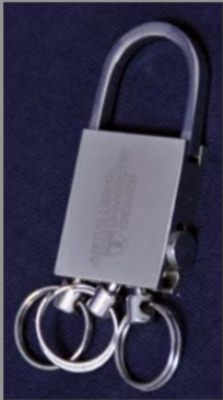
7 | Schlüsselanhänger