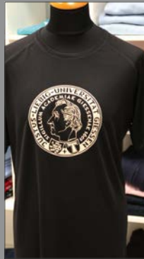
7 | Laufshirt

Poloshirt T-Shirt Sweatshirt Longsleeve Cap Jacke Laufshirt