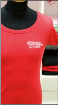
1 | Damen T-Shirt