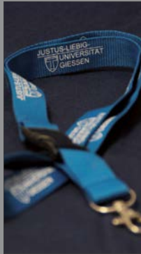
8 | Schlüsselband