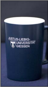
1 | Tasse