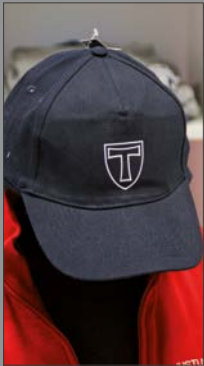
5 | Kappe