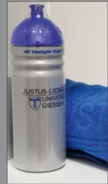
12 | Handtuch + Trinkflasche