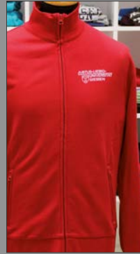
4 | Zipjacke