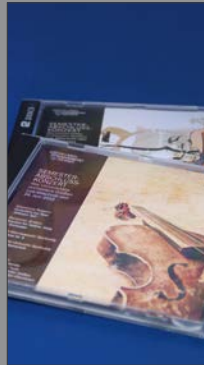
8 | CDs