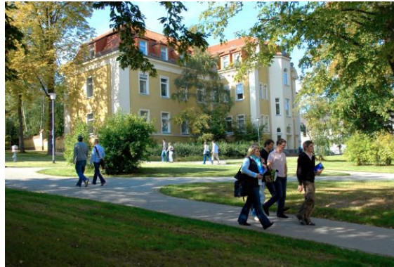
Campusgelände FB 02