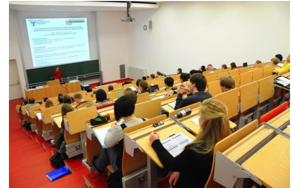
Hörsaal am FB 02