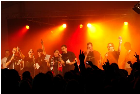
Professorenband am Campusfest