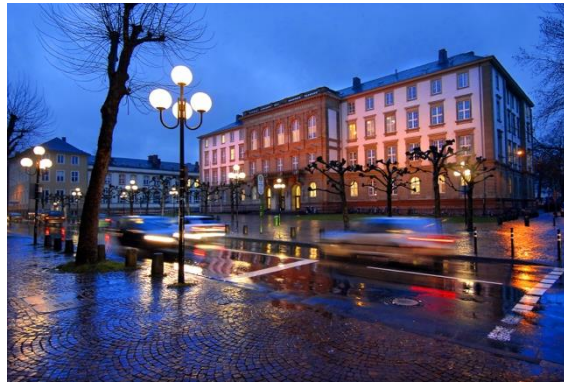
Hauptgebäude der JLU bei Nacht