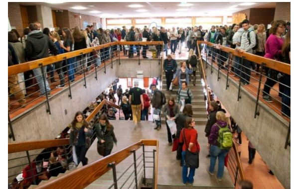
Semesterbeginn am Philosophikum