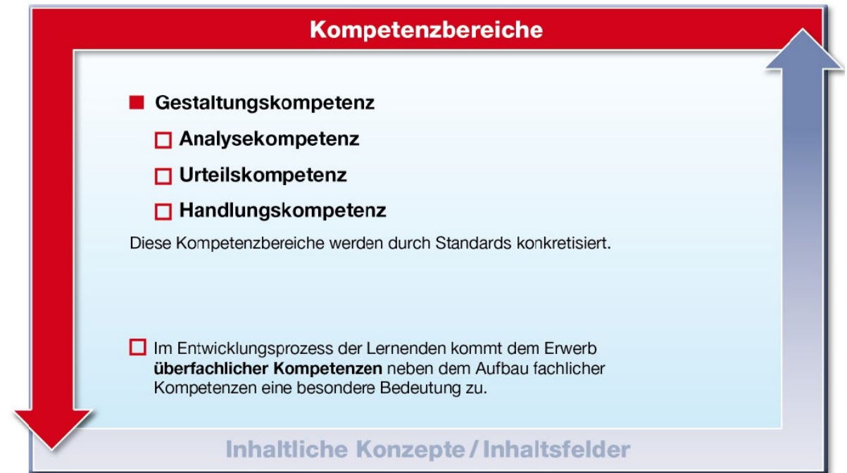
Abb. 1: Kompetenzbereiche im Fach Arbeitslehre

Das Fach Arbeitslehre hat seine Wurzeln in solchen pädagogischen Ansätzen, die sich beispielsweise in den frühen Industrie- und Arbeitsschulbewegungen finden (Pestalozzi, Rousseau, Kerschensteiner und andere). Gemeinsam ist diesen Konzepten die menschliche Arbeitstätigkeit in die Bildung von Jugendlichen mit einzubeziehen. (HKM o. J.: 11)