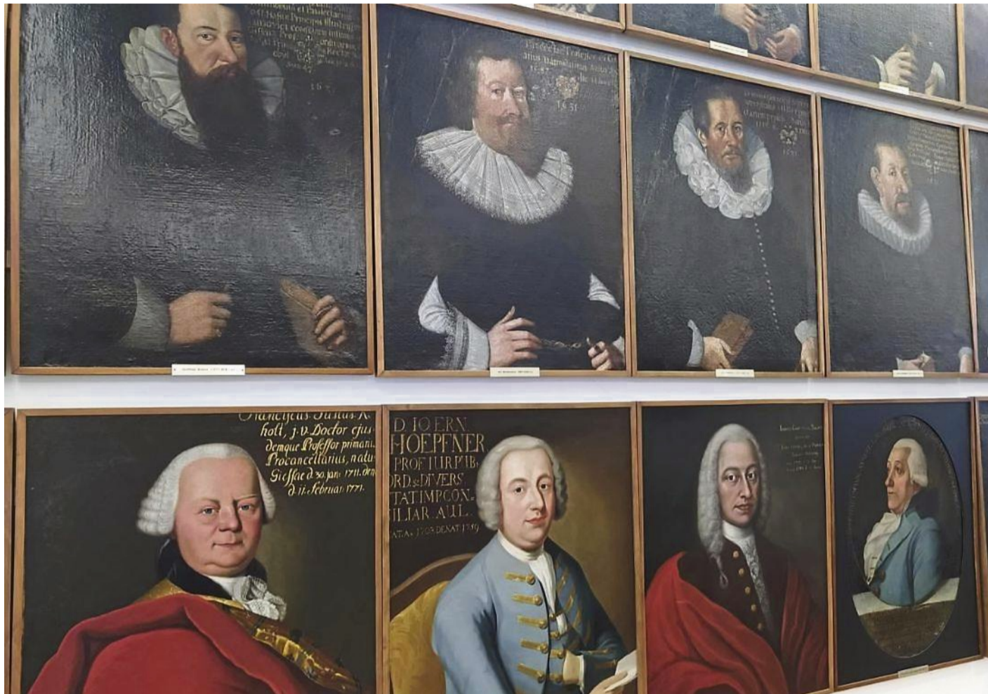
Die Professorengalerie im Senatssaal im Uni-Hauptgebäude.

1607 wurde in Gießen die Universität als protestantisches Gegenstück zur Universität Marburg gegründet. Das Porträt des Initiators der „Ludoviciana“ und ursprünglichen Namensgebers, Landgraf Ludwig V. von Hessen-Darmstadt, hängt noch heute als Ganzkörperbild in der Uni-Aula, daneben das Bildnis von Großherzog Ernst Ludwig. Landgraf Georg II. war es schließlich, der eine Porträtfolge von Professoren nach dem Vorbild anderer Universitäten initiierte. Davon sind heute noch 106 der 108 Einzelporträts erhalten, die seit 1993 im Senatssaal des Uni-Hauptgebäudes hängen. Allerdings sind sie für die Öffentlichkeit nur sehr selten zu sehen. Mit diesen Professorenporträts sei ein erster Wille zur Systematik erkennbar gewesen, berichtete Ruby, und das in einer Zeit, als die Universitäten Marburg und Gießen kurzfristig nach einem Erbfolgestreit zusammengelegt worden waren. Erst 1650 kehrten 23 der Bildnisse wieder nach Gießen zurück. Man habe dabei das „zeitypische Repräsentationsmedium“ Porträt gewählt. Acht lokale Künstler wurden beauftragt, die Bildnisse zieren Name, Alter und Datierung. Die Professoren mussten sie aus eigener Tasche bezahlen, in einer