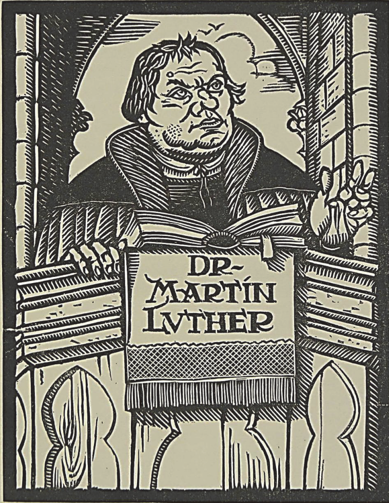
„Holzschnitt“ in Gaston Vorbergs Edition der Monachopornomachia (1919)