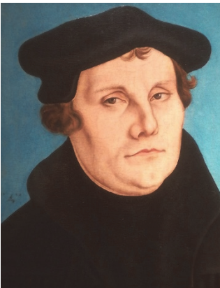
Werkstatt Lucas Cranachs d. Ä.: Martin Luther (1528)