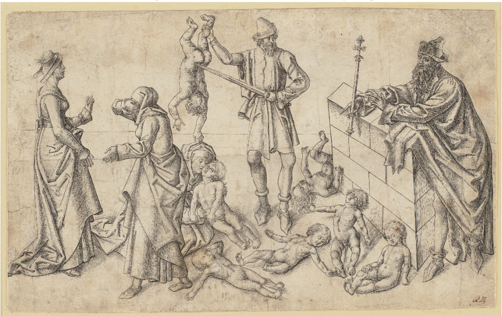
Monogrammist PM: Der Kindermord zu Bethlehem (1480/90), Städel Frankfurt.

Obwohl er in der Realität nie stattgefunden hat, erfreut sich das Motiv des Kindermords von Bethlehem durch die Jahrhunderte einer regen Beliebtheit, nicht nur bei der Darstellung der Weihnachtsgeschichte. Gerade in den Unruhen der frühen nach-reformatorischen Zeit wurde dieses Element häufig genutzt, um die religionspolitische Gegenpartei zu diffamieren und die Motivation, für den Glauben Qualen bis hin zum Tod zu erdulden, bei der eigenen Seite zu stärken. Da die ermordeten unschuldigen Kinder in der Überlieferung als die ersten christlichen Märtyrer gelten, boten sie einen