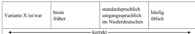
Abbildung 2. Achse der Normativität.

Wie bereits gezeigt wurde, sind Marker aller drei Dimensionen der Gültigkeitsbeschränkung miteinander kombinierbar, was aber auch nicht ausschließt, dass eine Variante ggf. mehrere diasystematische Marker erhält (Beispiel Genuszuweisung bei Virus : „der/das Virus (allgemeinsprachlich und in der Fachsprache der Informatik)“, Duden 2009, 168). Wenn eine Variante nicht explizit mit einem dianormativen Marker versehen ist, muss der Leser aufgrund der gemachten Angaben selbst auf die Korrektheit der Variante in einem bestimmten Kontext schließen. Die Achse der Normativität liegt also gewissermaßen quer zu den drei Dimensionen der Gültigkeitsbeschränkung, d. h., was zum angegebenen Zeitpunkt in der angegebenen Varietät mindestens häufig ist, kann als „korrekt“ gelten.