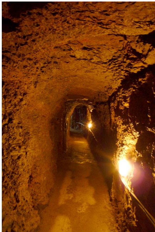
Impressionen aus der Goetz-Höhle