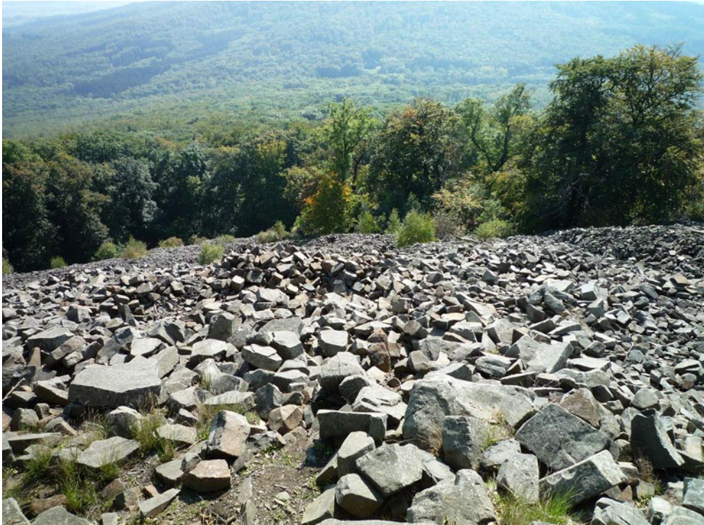
Auf dem Gipfel des Kleinen Gleichberges (642 m üNN) mit bedeutenden Blockakkumulation am Südhang. Der Wald im Hintergrund gehört bereits zur Nordflanke des Großen Gleichberges (679 m üNN).