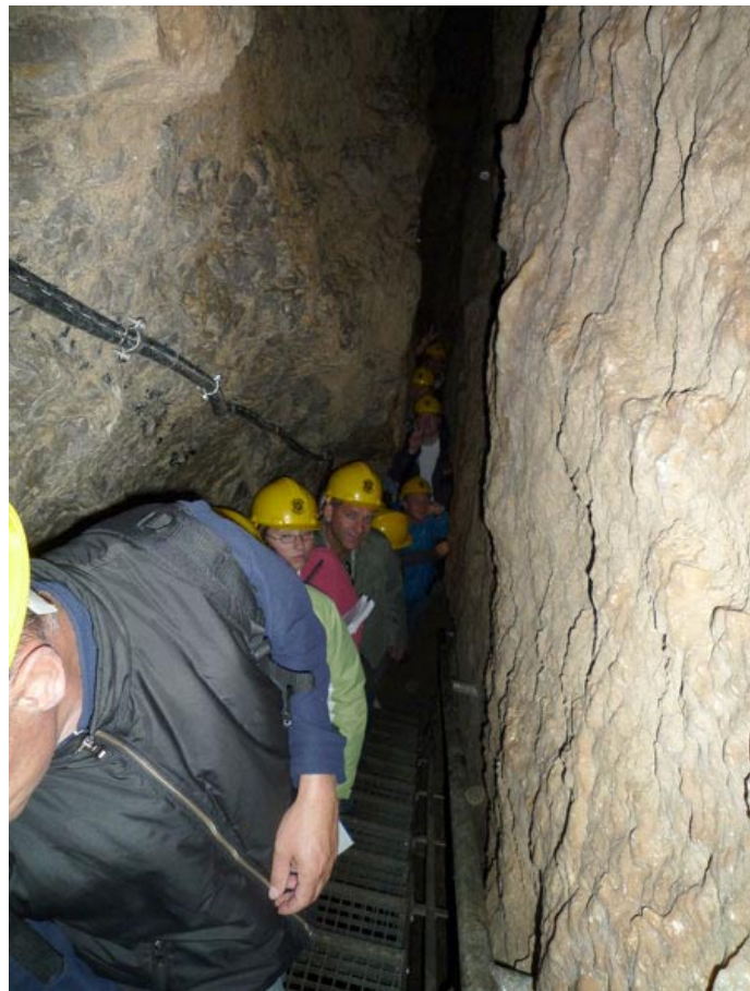
Impressionen aus der Goetz-Höhle