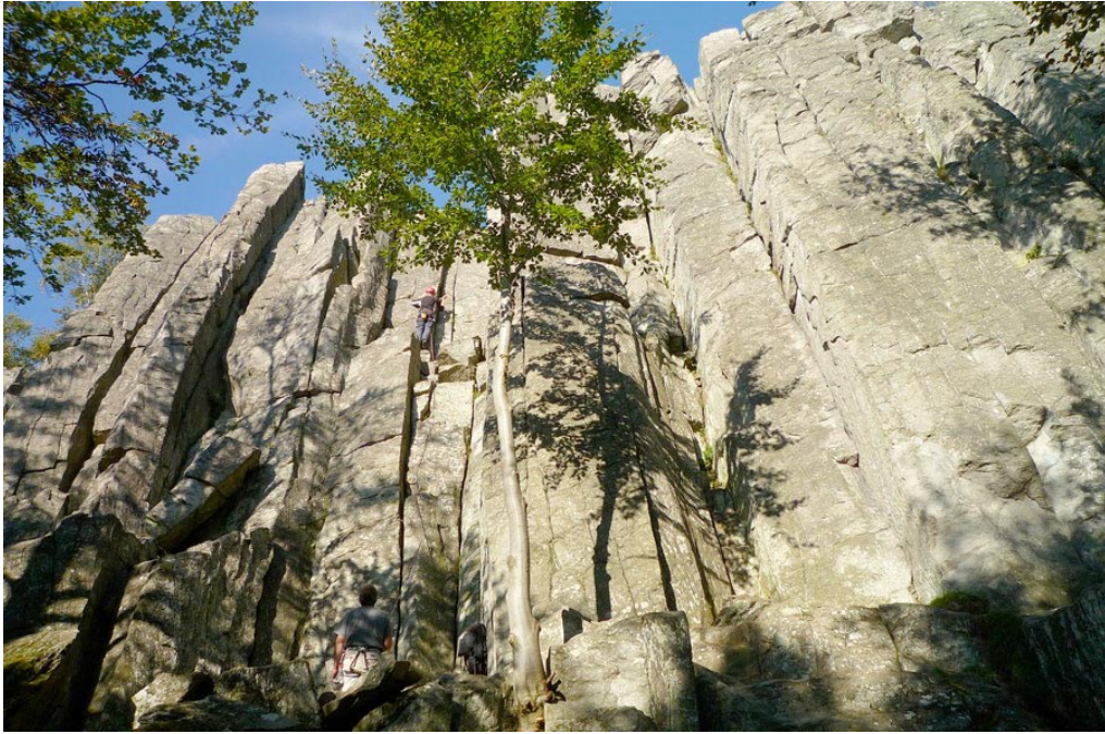
Die steilen Phonolith-Säulen der Steinwand sind bei Sportkletterern sehr beliebt.