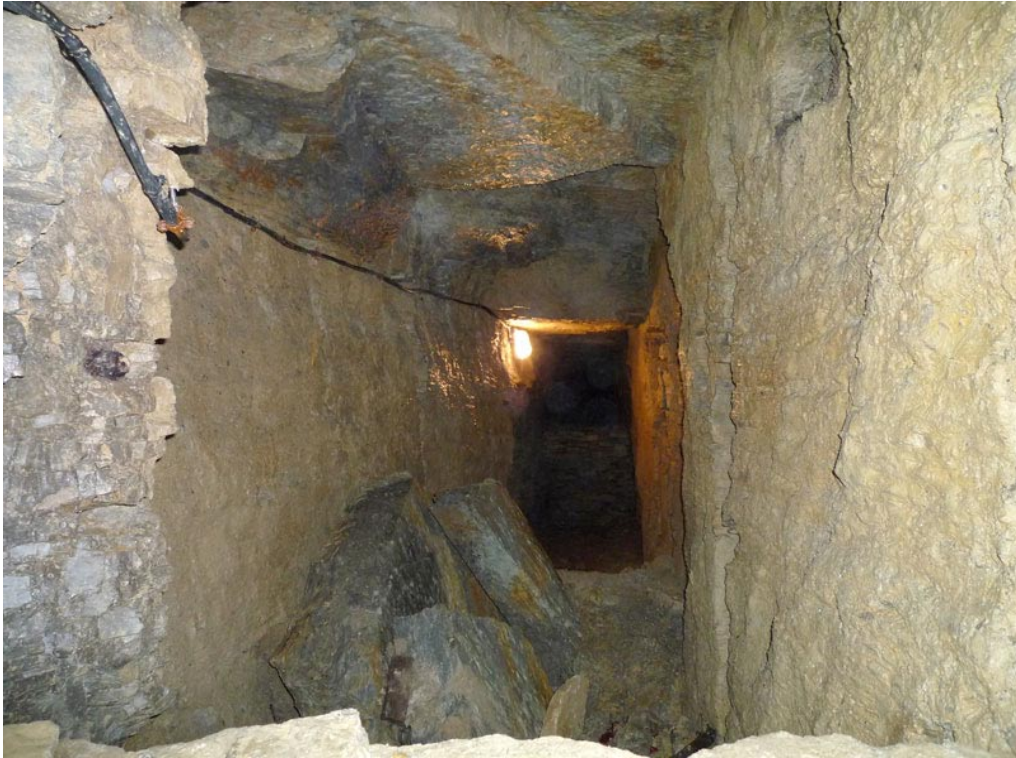
Impressionen aus der Goetz-Höhle