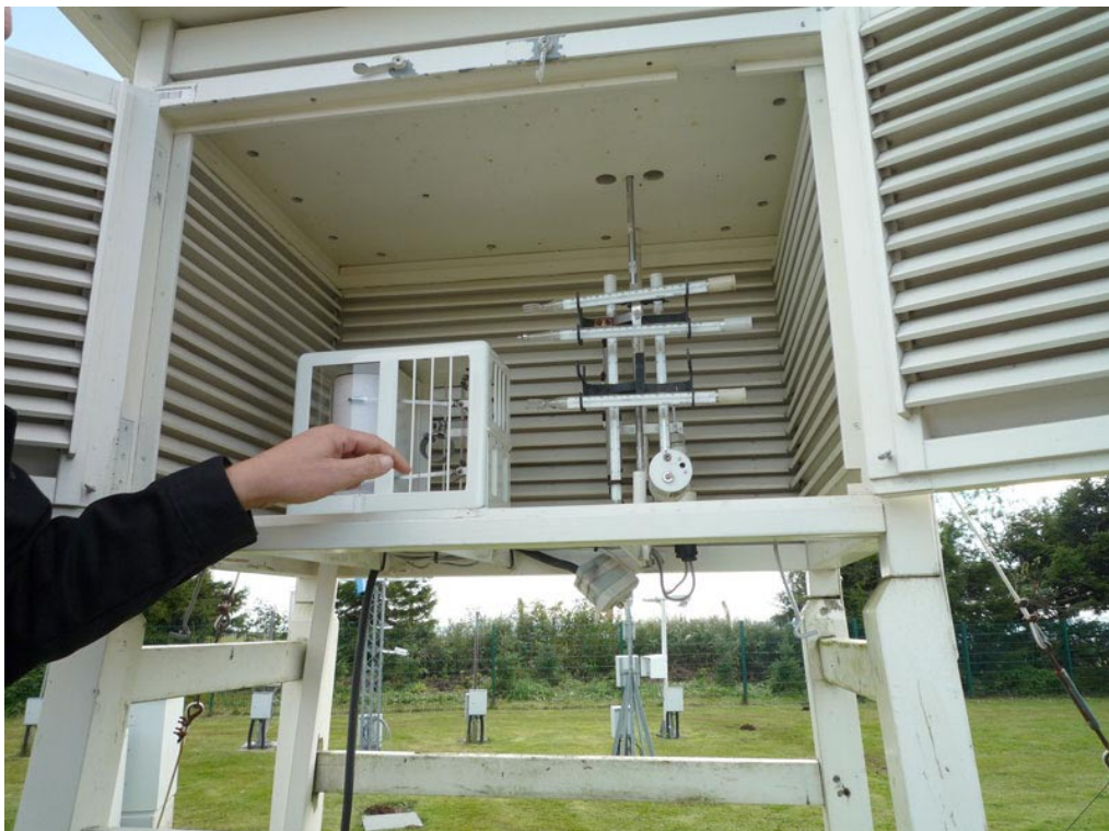
Blick in die Thermometer-Meßhütte der Wetterstation Wasserkuppe

In der Wetterstation Wasserkuppe des DWD wird auch die in der Luft vorhandene Radioaktivität routinemäßig erfaßt. Diese Kontrollstation wurde als Reaktion auf die schwere AKW-Havarie Tschernobyl im April 1986 eingerichtet. Seit Inbetriebnahme der Kontrollstation sind die Grenzwerte in keinem Fall überschritten worden.