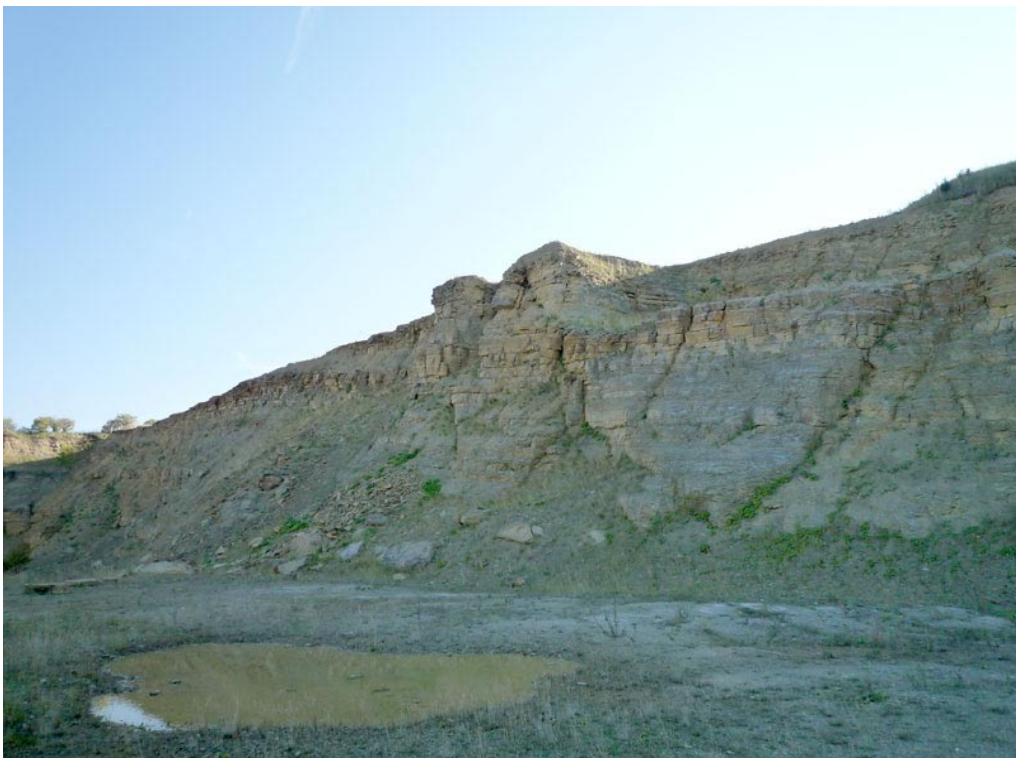
Steinbruch in den hier sehr fossilreichen Abfolgen des Unteren Muschelkalks bei Kaltennordheim. Durch Verkarstung der liegenden Kalke sowie Lösungsvorgänge im salinar geprägten Oberen Buntsandstein (Subrosion) sind die ehemals horizontal lagernden Schichten leicht verkippt. In unmittelbarer Nähe des Steinbruchs befindet sich ein großflächiges Dolinenfeld.