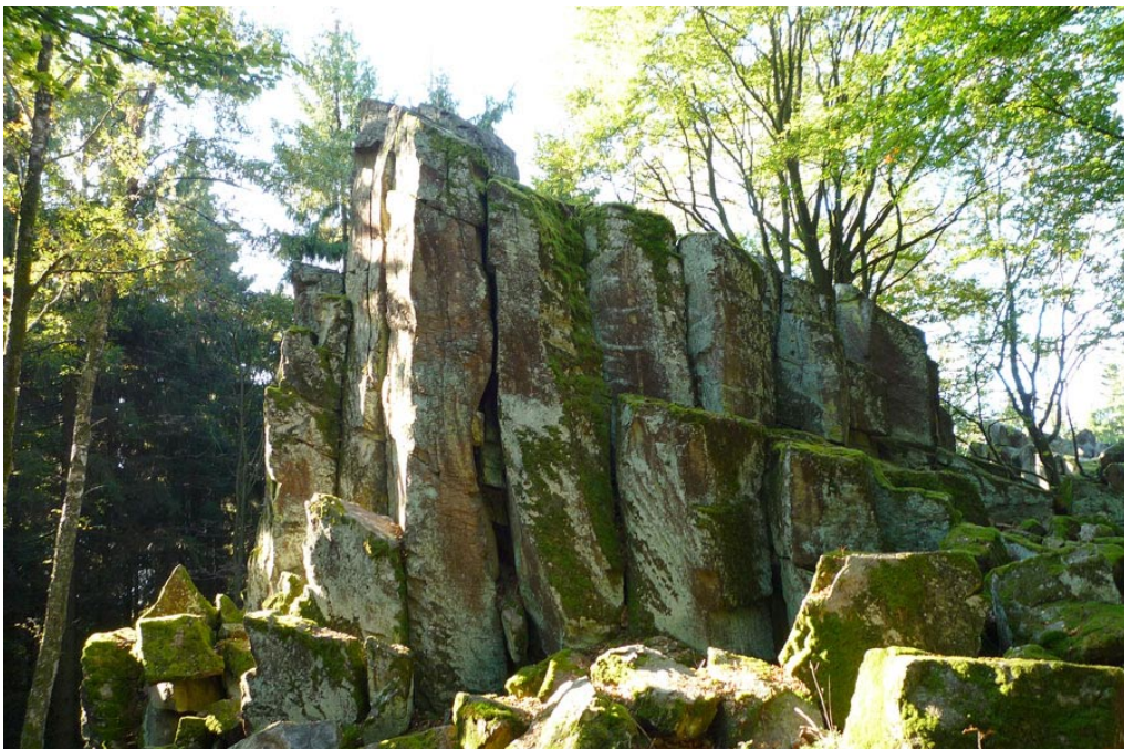
Impressionen von der Steinwand