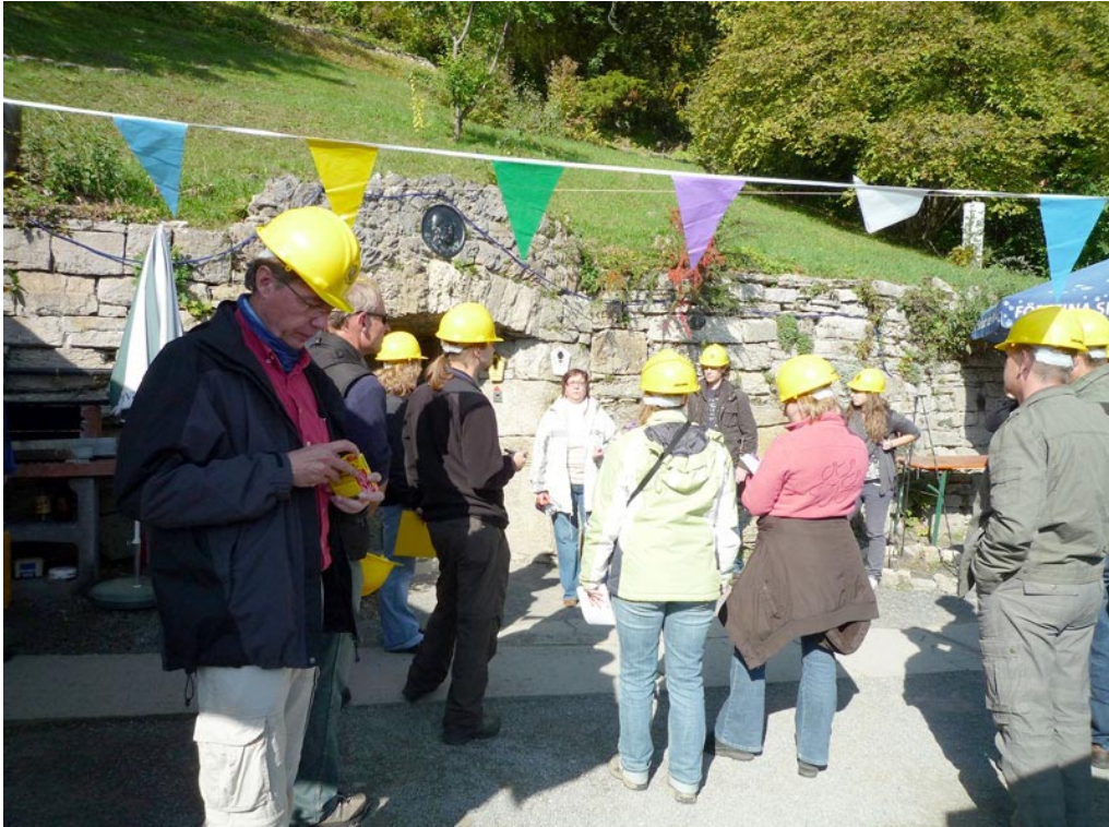
Die Studierenden am Eingang zur Goetz-Höhle oberhalb Meiningen. Im Hintergrund erkennt man das steile Gelände, das nach E zur Werra-Aue hin abfällt.