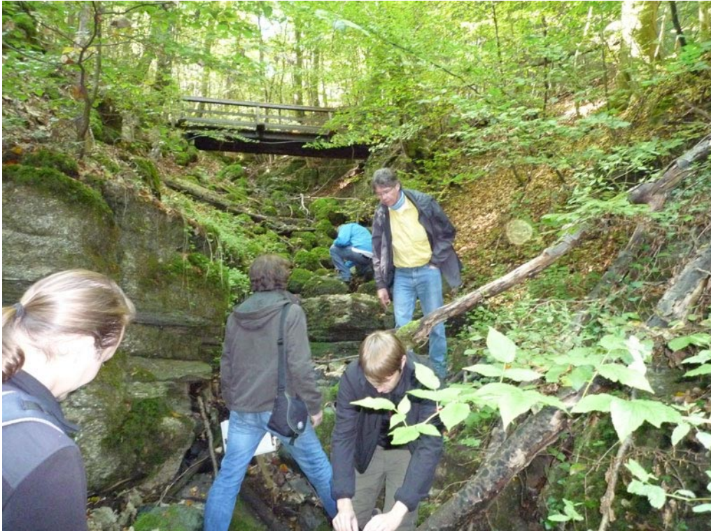
An einer Bachschwinde unterhalb der Teufelhöhle