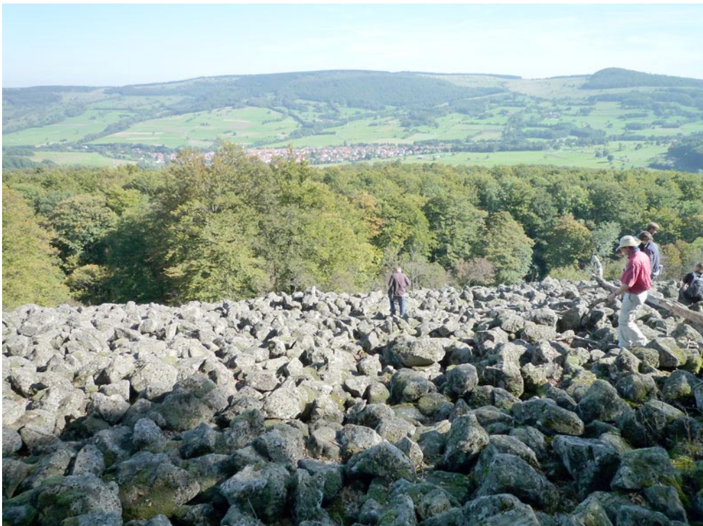
Blockakkumulation am E-Hang des Schafsteins