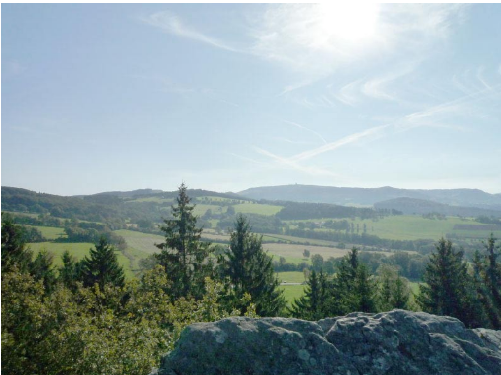
Blick von der Steinwand in südöstliche Richtung auf das Hochplateau der Wasserkuppe