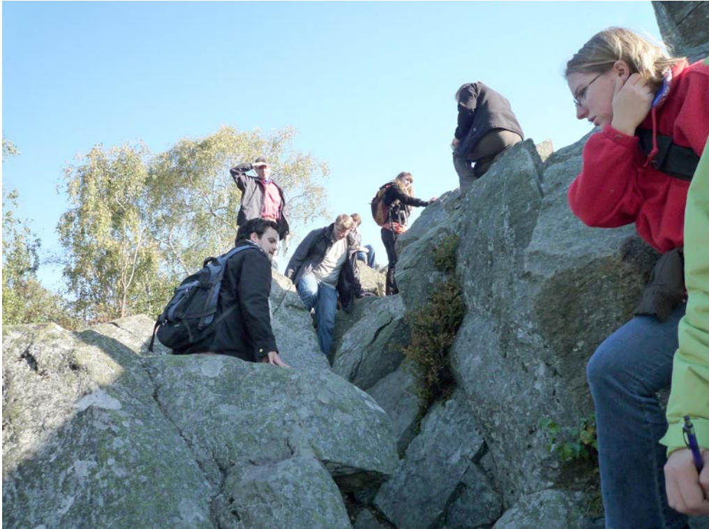
Auch die Studierendengruppe versucht sich etwas im Klettern.