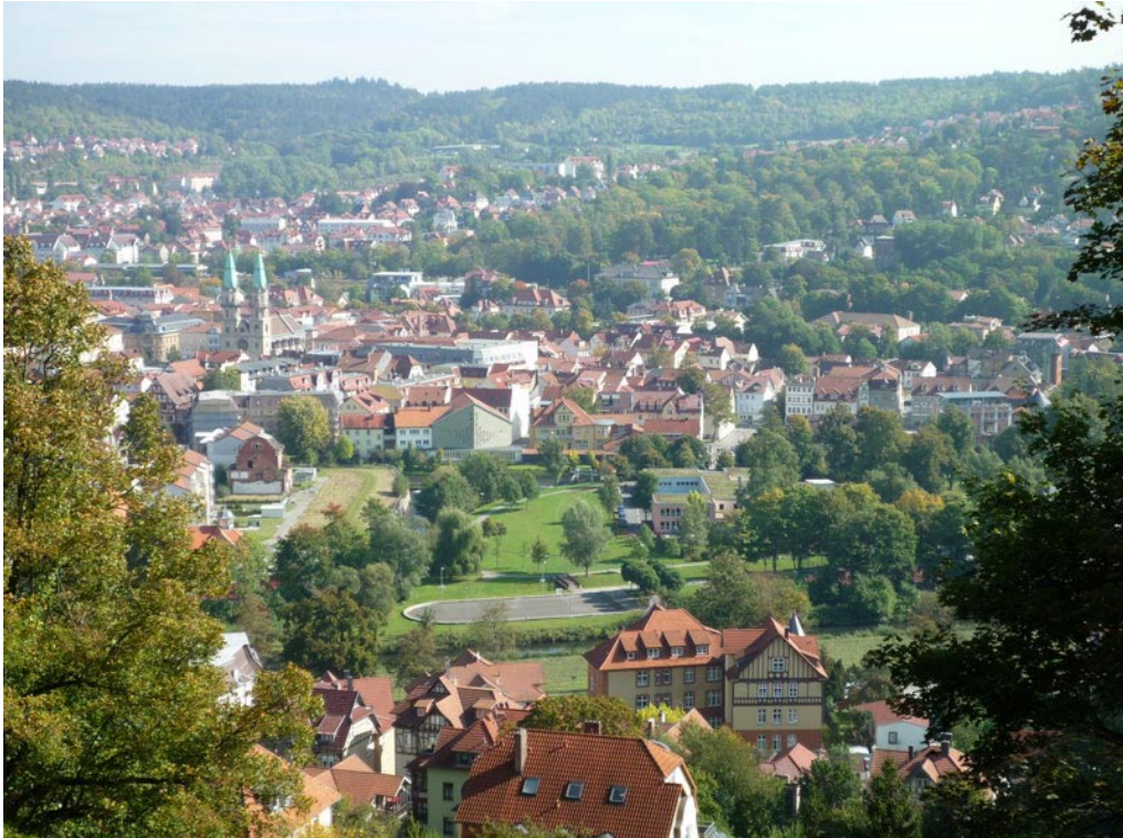
Blick von Eingangsbereich der Goetz-Höhle hinunter auf Meiningen an der Werra