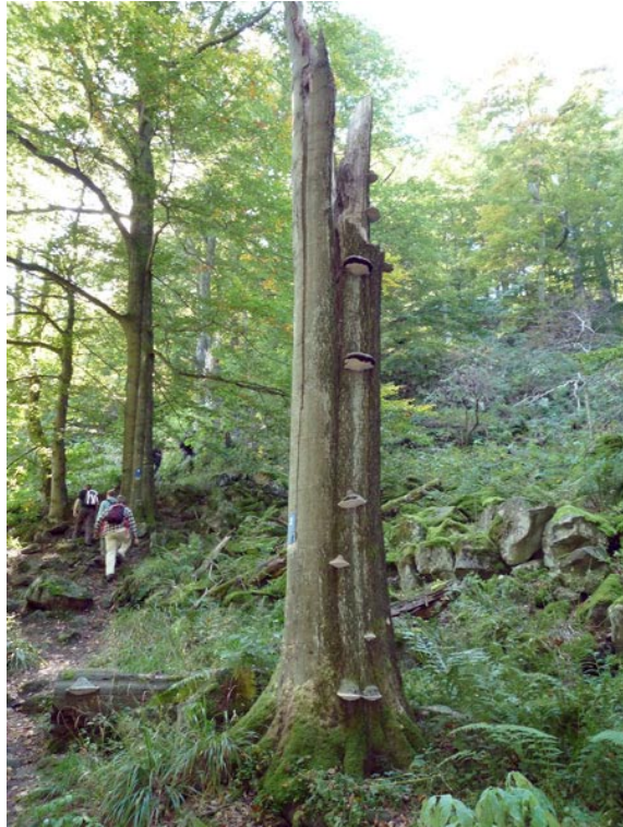
Aufstieg zum Schafstein; Todholz mit Baumpilzen