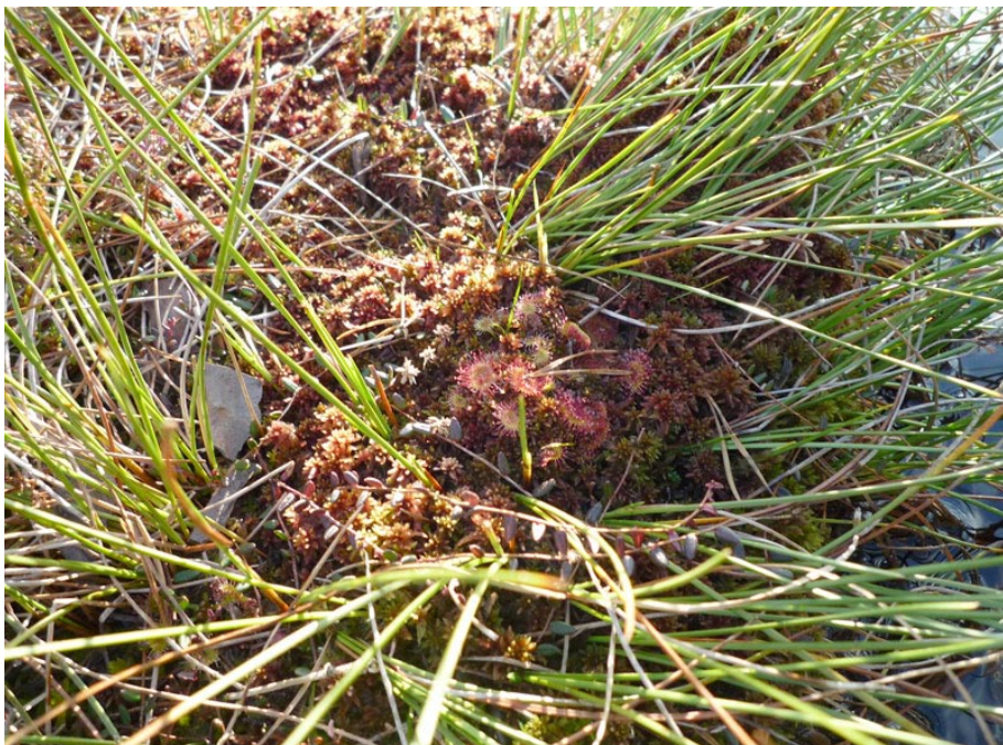
Sonnentau im Schwarzen Moor

Die Exkursionsgruppe am Eingang zum Schwarzen Moor auf ca. 780 m üNN, oberhalb Wüstensachsen (Hessen), Frankenheim (Thüringen) und Fladungen (Bayern). Das etwa 60 ha große Schwarze Moor liegt in einer flachen Hangmulde (782 m bis 770 m) auf der von tertiären Basalten und Tuffen geprägten Hochebene der Langen Rhön. Es verdankt seine Entstehung den recht hohen Jahresniederschlägen (um 1000 mm; nur Niederschlag, Nebel nicht berücksichtigt) sowie wasserstauenden Schichten im Untergrund der periglazialen Hangmulde. Im Gegensatz zu vielen anderen Mooren der Rhön hat das Schwarze Moor noch einen relativ ursprünglichen Charakter, da es von Trockenlegung und Torfabbau weitgehend verschont blieb. Entlang des Rundweges sind verschiedene Moorstadien wie Niedermoor, Randgehänge und uhrglasförmig aufgewölbtes Hochmoor sehr gut zu erkennen ( geotope.bayern.de ).