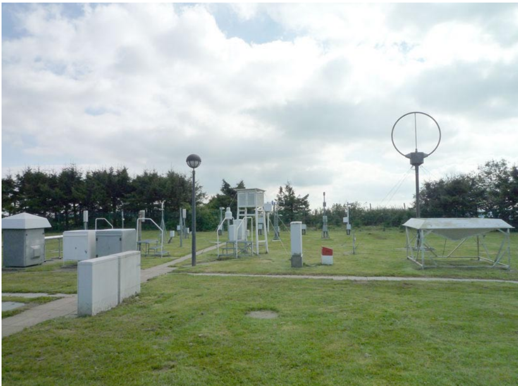
Blick auf das Außenbereichs-Meßfeld der Wetterstation Wasserkuppe des Deutschen Wetterdienstes (DWD). Unter anderem sind zu erkennen: verschiedene Auffang-Behälter zur Messung des Niederschlags, Thermometerhütte in 2 Meter über GOK, Luftschwebstoffsammler, Nachtwolkenscheinwerfer, Sonderfunkantenne.