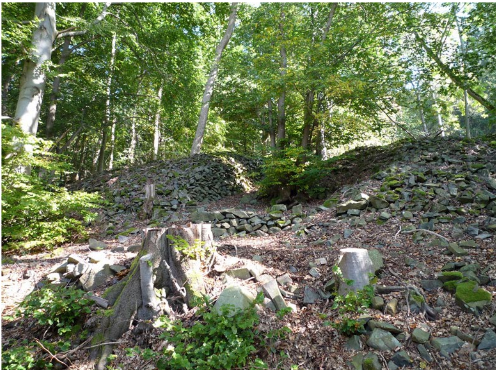
Reste eines keltischen Ringwalles im SW-Hang des Kleinen Gleichberges (Vulkanfeld Heldburger Gangschar)