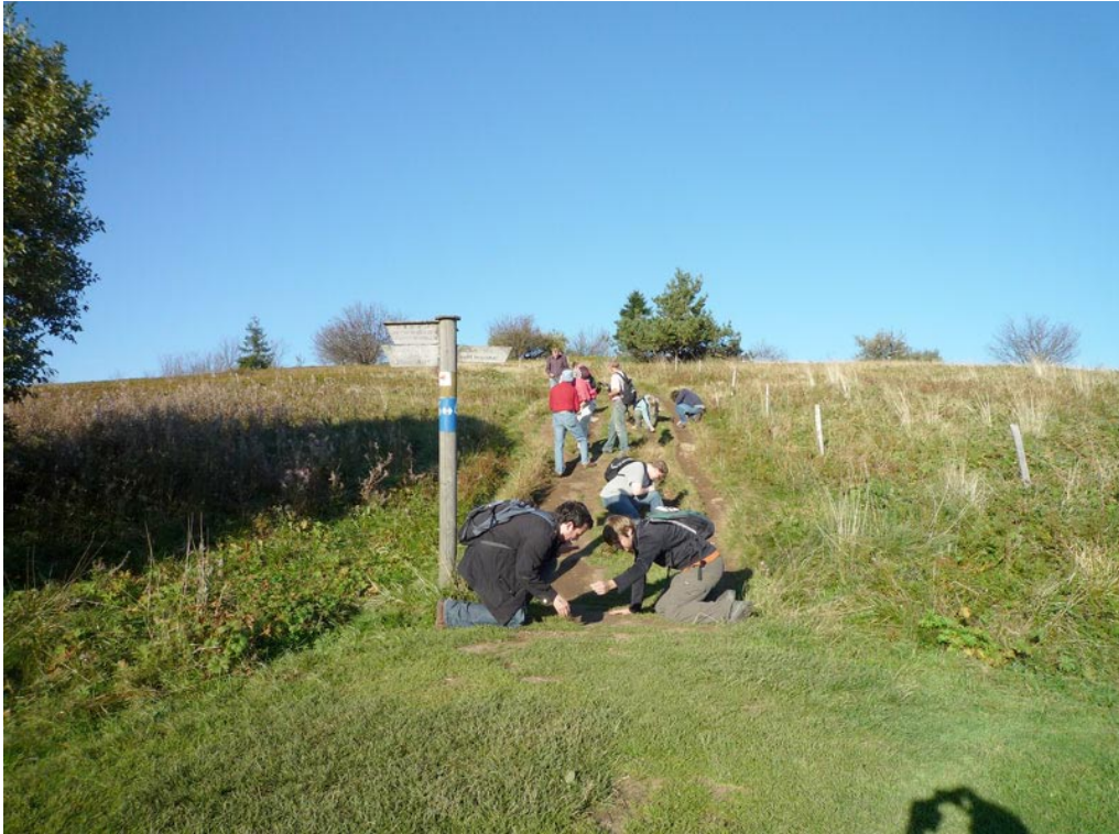
Die Studierenden sind auf der intensiven Suche nach großen idiomorphen Hornblende-Kristallen, die hier aus den anstehenden basaltischen Tuffen herauswittern.