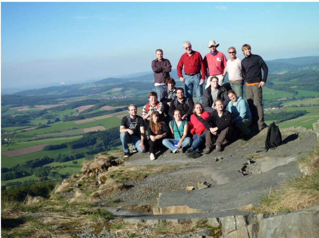
Gruppenbild auf der Abtsrodaer Kuppe (905 m üNN)

Durch refraktionsseismische Messungen konnte nachgewiesen werden, dass die Blockakkumulation am Schafstein bis zum anstehenden Gestein über 30 Meter beträgt.