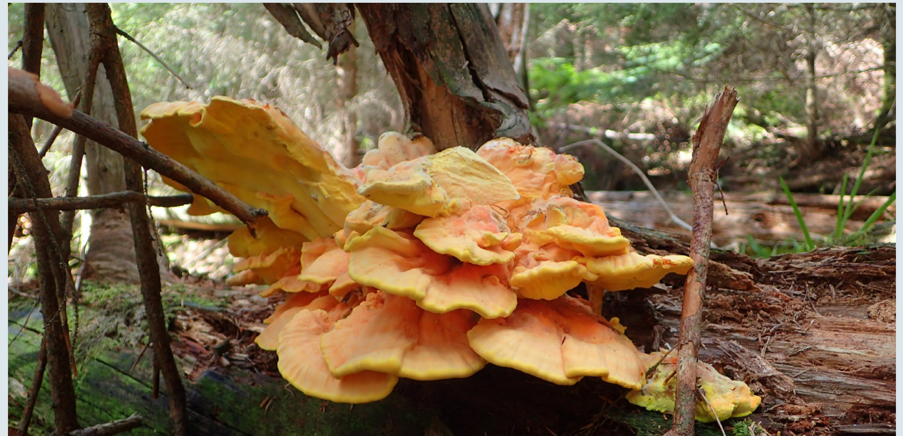
Abb. 1: Fruchtkörper von Laetiporus montanus auf Fichtentotholz im Nationalpark Schwarzwald

Basidiomycota können eine wichtige Rolle bei der Aromatisierung von Lebensmitteln spielen. Laetiporus montanus (LMO) ist ein essbarer Basidiomycet, dessen Aromaprofil bislang unerforscht geblieben ist. LMO weist eine starke makroskopische Ähnlichkeit zum bereits gut erforschten, engen Verwandten Laetiporus sulphureus (LSU) auf, weshalb die Differenzierung auf ITS-Sequenzierungen basiert [1]. Der hier verwendete LMO Stamm wurde im Nationalpark Schwarzwald auf Fichtentotholz (Abb. 1) gefunden und gilt als der erste gemeldete Fund im Bundesland Baden-Württemberg. Submerskulturen von LMO zeichneten sich durch ein äußerst würziges und „Maggi“-artiges Aroma aus.