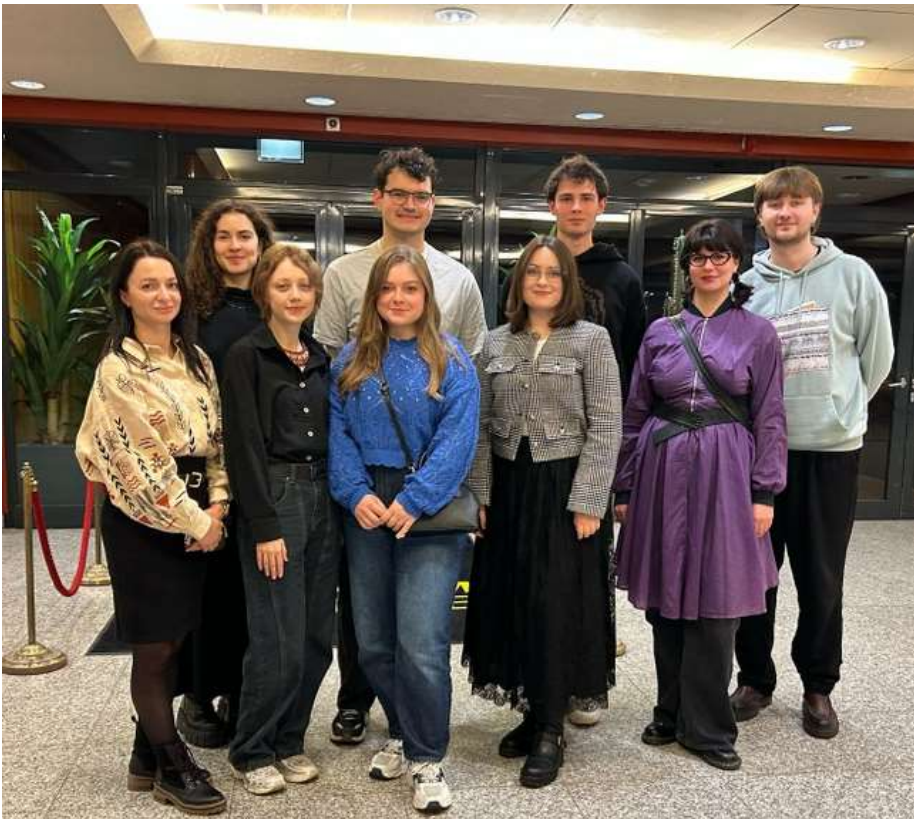
Die Stipendiatinnen und Stipendiaten (hier: neun MA-Studierende) bei einer gemeinsamen Kulturveranstaltung

Mehr unter: https://www.uni-giessen.de/de/fbz/zentren/gizo/aktiv/2024/ukr_digital