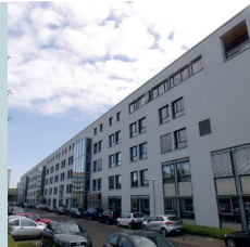
1 Rückseite des IFZ

Auf der Ostseite liegen die einheitlich großen Büroräume je mit bis zu drei Arbeitsplätzen. Die vollflächige Verglasung sorgt tagsüber für die Belichtung mit Tageslicht. Oberlichter über den Türen werfen Tageslicht in die Flure.