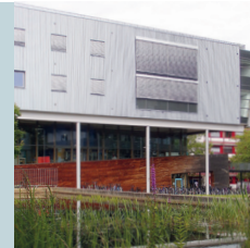
3 Nord-Ost-Ansicht mit Biotop