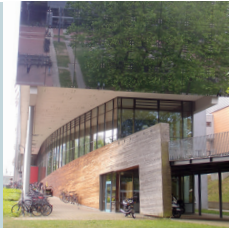
5 Nord-Ansicht mit Spiegel