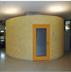
6 Treffpunkt 1. OG