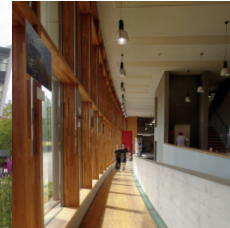
4 Die Rampe der Cafeteria