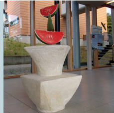
2 Kunst am Bau, Johannes Brus