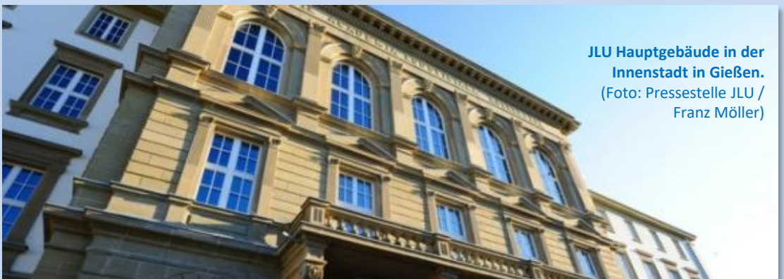
JLU Hauptgebäude in der Innenstadt in Gießen.