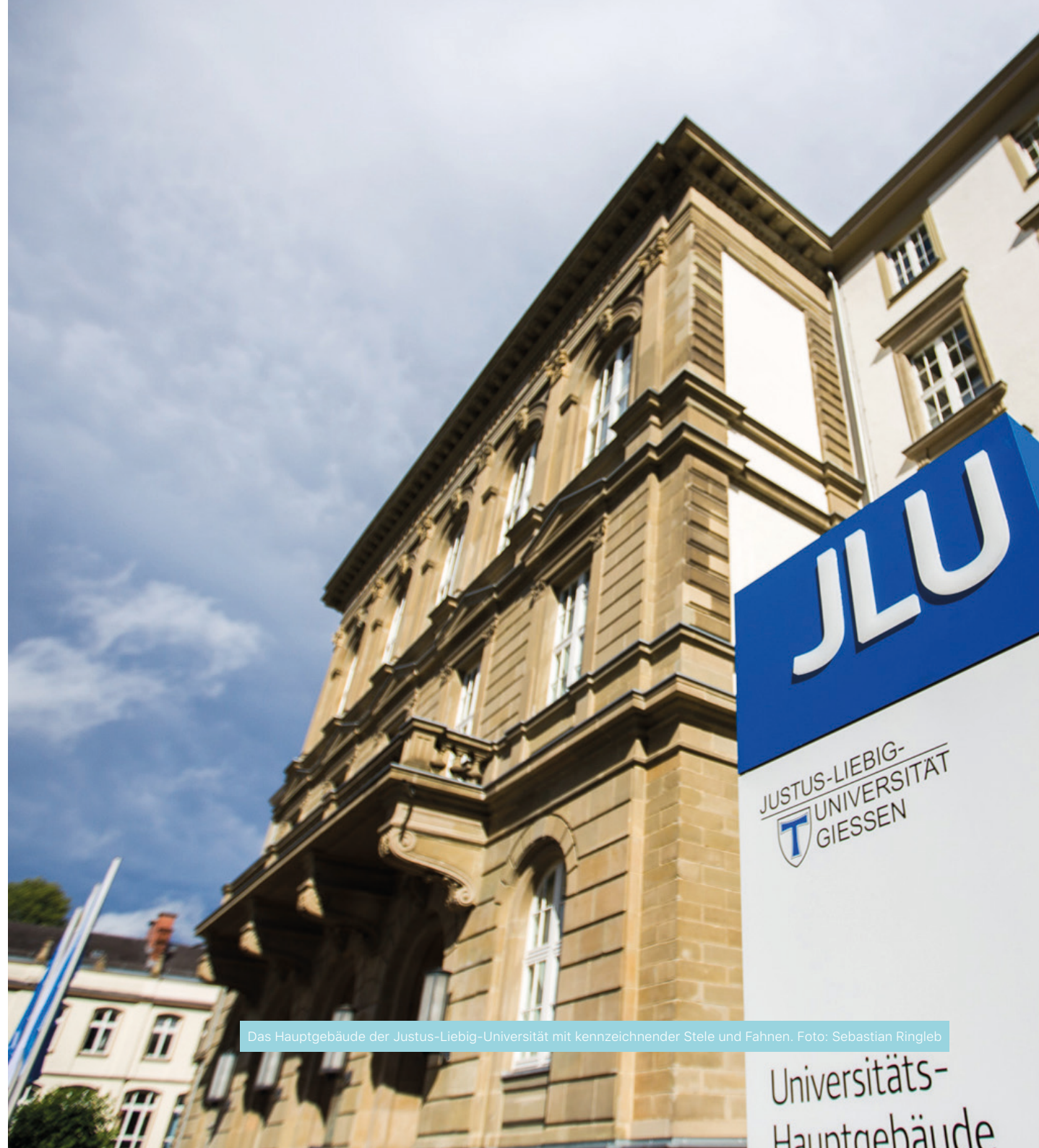
Das Hauptgebäude der Justus-Liebig-Universität mit kennzeichnender Stele und Fahnen.

Ort Raum 337, 3. Obergeschoss, Erwin-Stein-Gebäude, Goethestraße 58