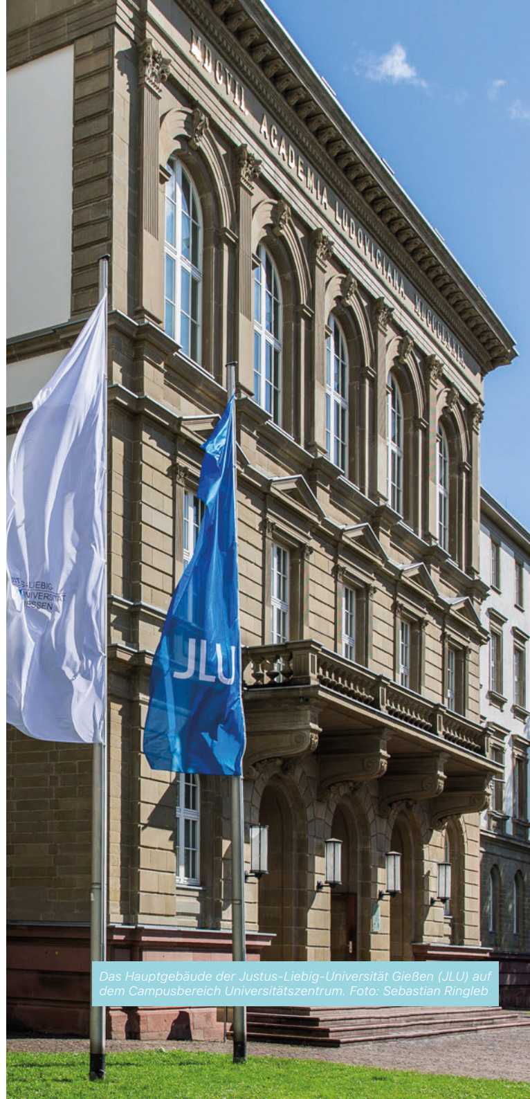
Das Hauptgebäude der Justus-Liebig-Universität Gießen (JLU) auf dem Campusbereich Universitätszentrum.