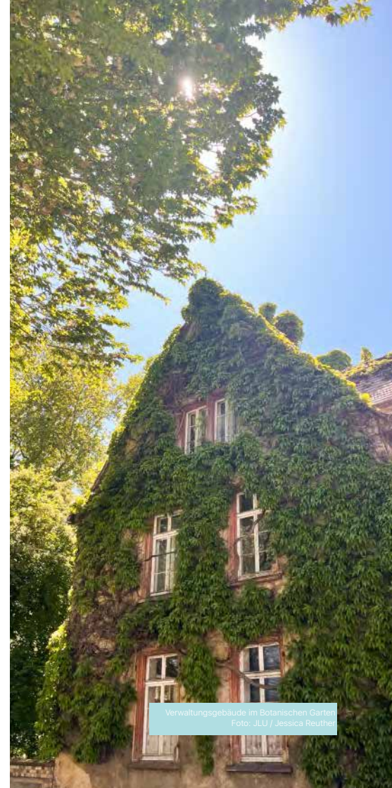
Verwaltungsgebäude im Botanischen Garten