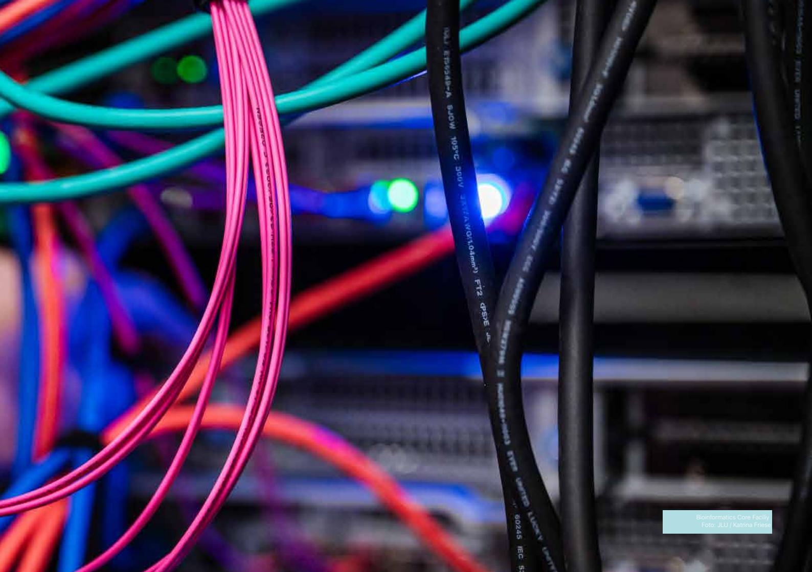
Bioinformatics Core Facility