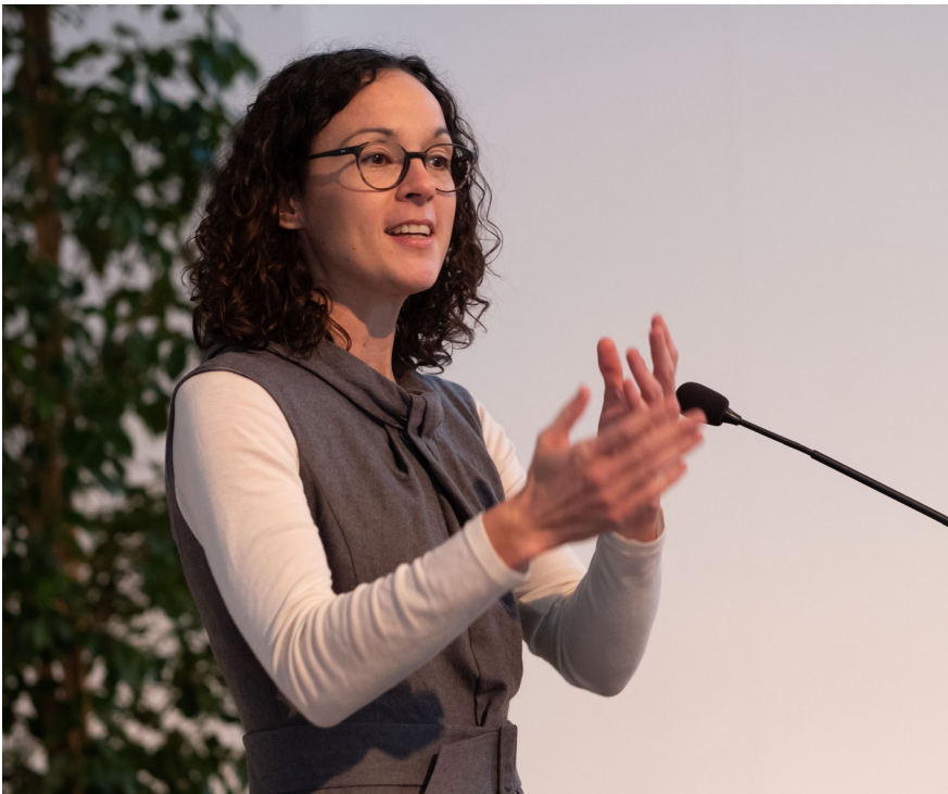
Akademischer Festakt der Justus-Liebig-Universität Gießen am 29. November 2019. Angela Dorn, Hessische Ministerin für Wissenschaft und Kunst, hielt die Festrede zum Thema „Wissenschaft in Zeiten gesellschaftlicher Spaltung“.

Zusätzlich zu den 11 Millionen Fördermitteln für die Gießener Offensive Lehrerbildung hat der Bund in einem