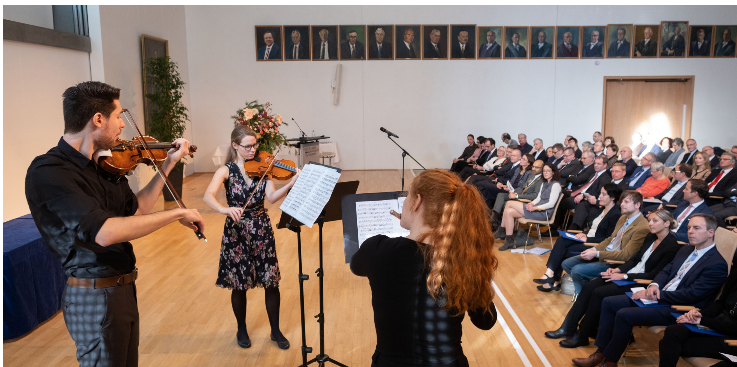
Festlicher Rahmen: Mitglieder des Universitätsorchesters spielten Stücke von Ludwig van Beethoven für Flöte, Violine und Viola.

für uns die beiden Säulen „Kommunizieren“ und „Beraten“ mindestens genauso wichtig für unsere „third mission“. Gerade im vergangenen Jahr hat diese Mission viele Aktivitäten an der JLU Gießen geprägt – einige wenige Beispiele will ich hier nennen: