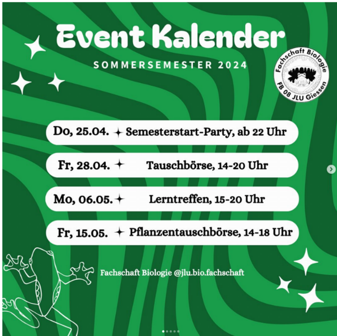
Design mit "Canva Pro", April 2024