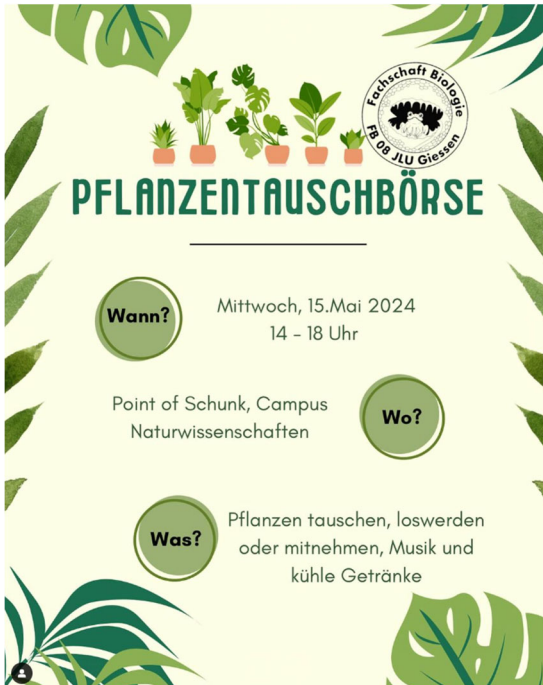
Design mit "Canva Pro", April 2024