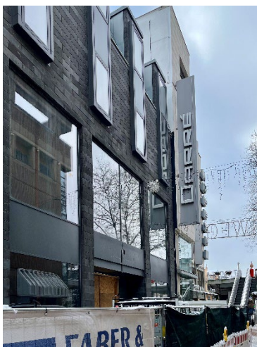
Große Glasfronten und gute Erreichbarkeit über die Frankfurter Straße: Die neue Heimat der Zweigbibliothek Natur- und Lebenswissenschaften.