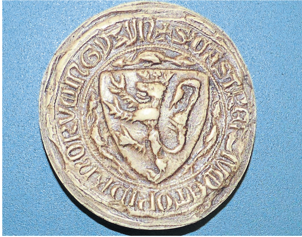
Das Gießener Stadtsiegel von 1343.

Die kleine Siegelammlung gehört zu den beiden Professuren für Mittelalterliche Geschichte und für Vergleichende deutsche Landesgeschichte. Sie ist längere Zeit in Vergessenheit geraten und rückte erst vor drei Jahren wieder in den Mittelpunkt des Interesses der Gießener Mittelalterforscher. »Auslöser für die Wiederentdeckung waren Aufräumarbeiten in einem größeren Magazinraum im Philosophikum I, der sowohl von der Fachbibliothek Geschichte als auch von mehreren Professuren im Historischen Institut genutzt wurde«, erzählt Tebruck. Dabei seien auch zwei größere Kisten aus dem Lagerbestand der Mittelalter-Professur zum Vorschein gekommen, in denen sich etwa 40 Abdrücke und Reproduktionen mittelalterlicher Siegel befanden. Weitere Nachforschungen förderten weitere 20