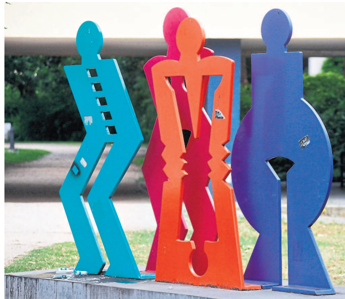
Seit zehn Jahren steht das Objekt an dieser Stelle.

Die Spielregeln: Von Montag bis Samstag alle Buchstaben