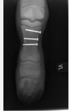
Behandlung: Osteosynthese mit 3 Zugschrauben