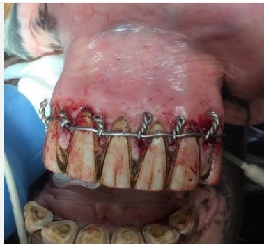
Fixierung mit Drahtcerclage