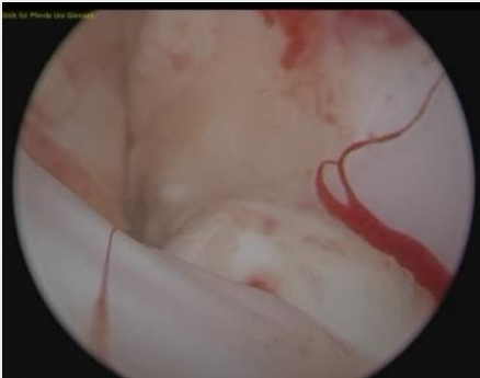
14-jähriges Vollblut Pferd Arthroskopie: Einblutung in das Sprunggelenk