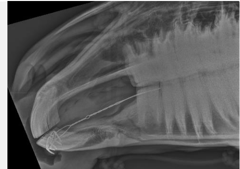
Kontrollröntgen nach der OP