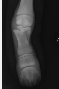
Salter-Harris-Fraktur des Fesselbeins