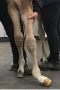
1 Tag altes Fohlen