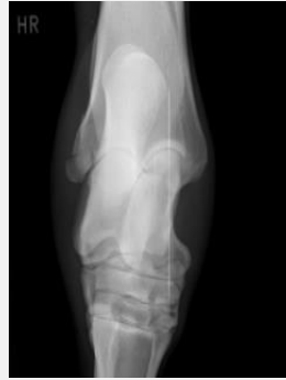
Fraktur des äußeren Knöchels