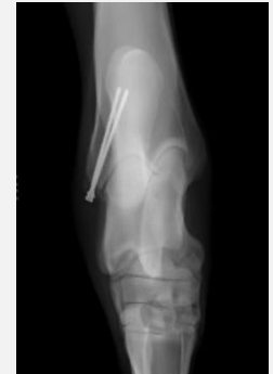
Behandlung mit 2 Zugschrauben