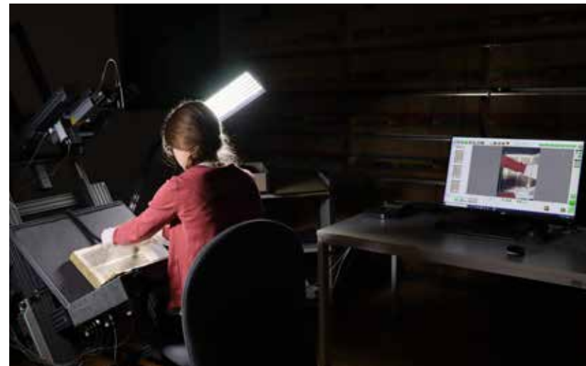
Ideale technische Voraussetzung: Aufwändige Arbeit am Grazer Buchtisch.

Die idealen technischen Voraussetzungen für die Digitalisierung eines solch umfangreichen Handschriftenbestandes (über 115.000 Scans) wurden – als Eigenleistung der Universitätsbibliothek für das Projekt – durch die Anschaffung eines Grazer Kamera- oder Buchtisches