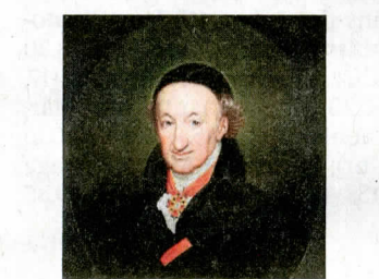
Christoph M. Wieland gemalt von G. von Kügelgen

seinem Wirken als »erster politischer Journalist«. Wieland war geistiger Vater dessen, was noch heute »Weimarer Klassik« genannt wird. »Das ist unsere Sprache und die ist