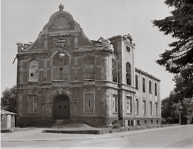
Die zerstörte Bibliothek.

Ausgelagert wurden die wertvollsten Bestände der UB in Kisten: die mittelalterlichen und neuzeitlichen Handschrif-